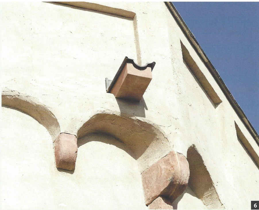
Abb. 6: Die Balustrade musste komplett neu aufgemauert werden.