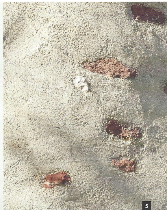
Abb. 4-6: tubag, Krufft