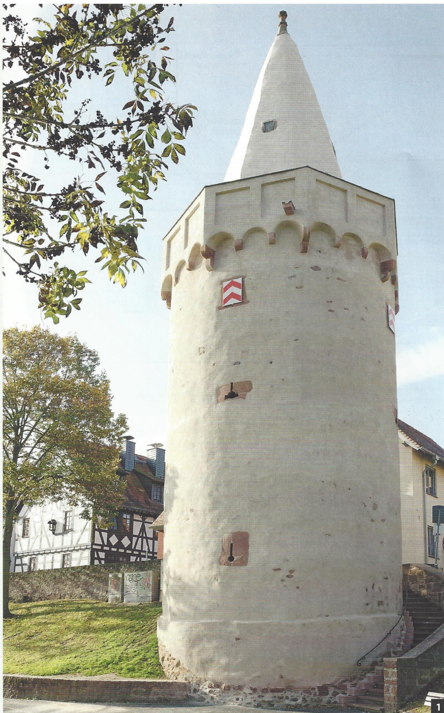
Abb. 1: Turm und Turmhelm waren schon im Mittelalter durchgehend verputzt. Die Sanierung mit einem Kalkputz orientierte sich so nah wie möglich am historischen Befund.

Größe Teile der alten Befestigungsanlagen von Seligenstadt wurden im 19. Jahrhundert abgerissen. Umso wichtiger nimmt die Stadt die Aufgabe, die verbleibenden Zeugnisse der Baukunst zu erhalten. Das aktuelle Projekt, der von den Seligenstädtern „Mulaul“ genannte Pulverturm, erscheint seit August 2012 in neuem und historisch korrektem Gewand (Abb. 1). Der circa 24 Meter hohe Turm bildet den nördlichen Abschluss der Altstadt und war früher ein Teil der Stadtmauer.