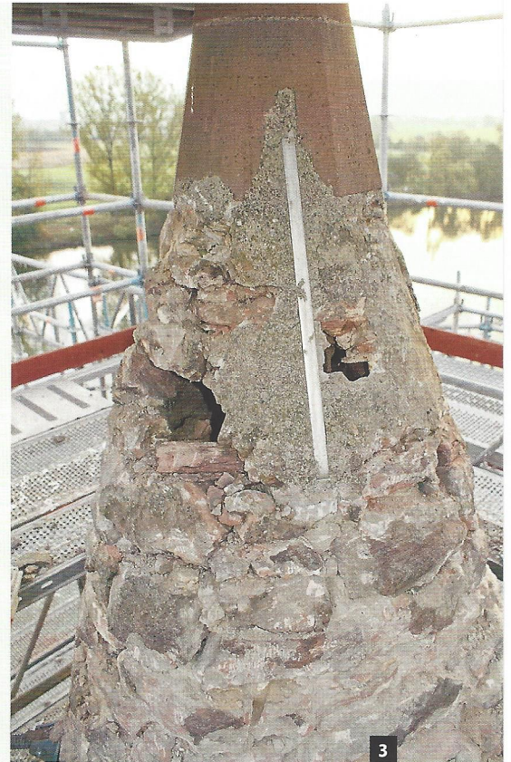
Abb. 2: Kartographierung des Zustands vor der Sanierung: An vielen Stellen konnte der marode Altputz mit der Hand entfernt werden.